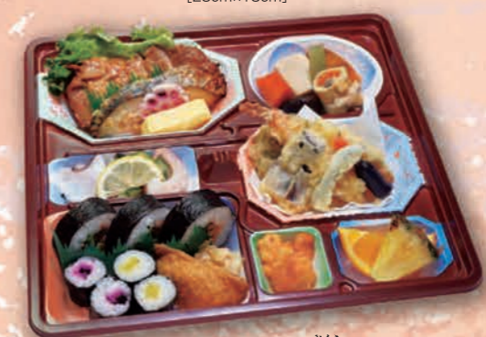
さくら 寿司弁当 [桜] 2,200円(2,000円税抜価格) [32cm×29cm]