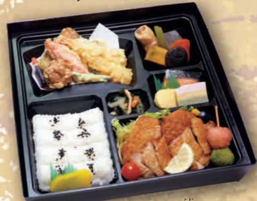
ふじ 幕ノ内弁当 [藤] [30cm×30cm] 2,420円(2,200円税抜価格)