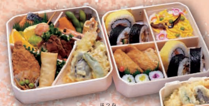
はつね 二段重ね [初音] 2,860円(2,600円税抜価格) [6.5寸/19cm×19cm]

それぞれの季節に彩られるお弁当。 季節の行事にはもちろん、 会議などにもご利用ください。