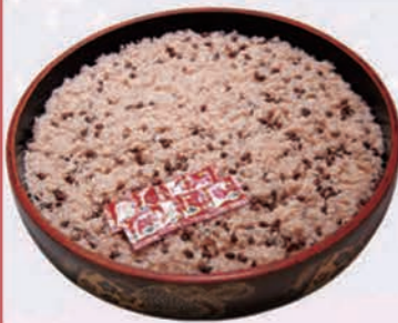
一升 3,850円(3,500円税抜価格) [47cmφ]