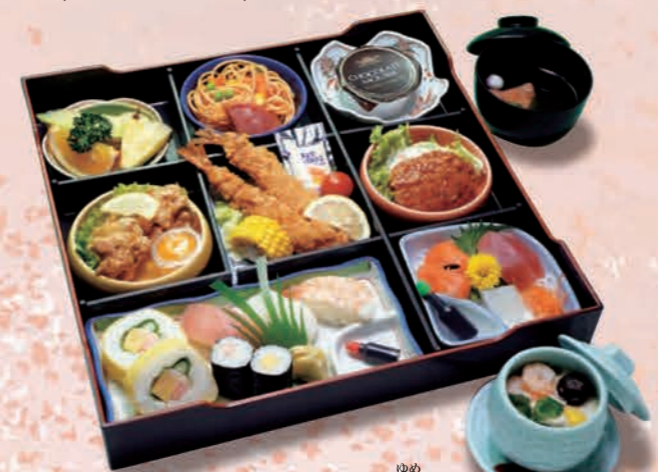
ゆめ お子様松花堂御前 [夢] 3,960円(3,600円税抜価格) [38cm×38cm]