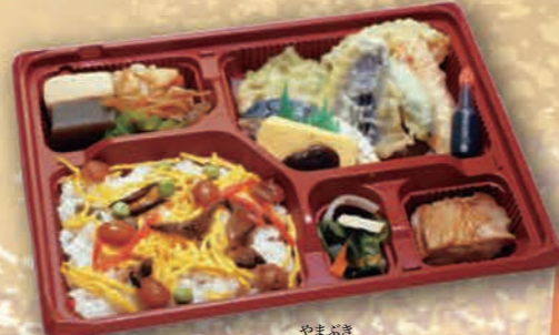
やまぶき 寿司弁当 [山吹] [27cm×21cm] 935円(850円税抜価格)