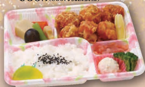
唐揚げ弁当 [27cm×22cm] 1,320円(1,200円税抜価格)