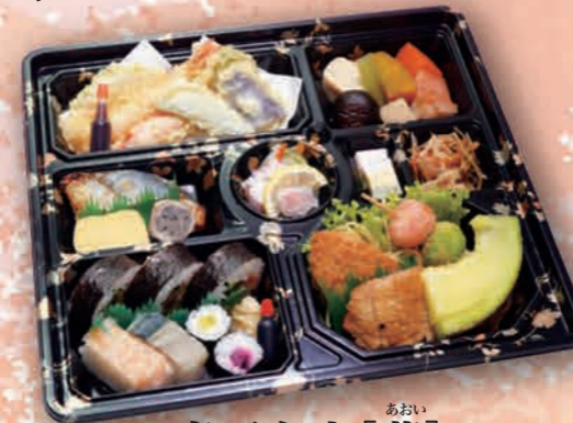
あおい 寿司弁当 [葵] 2,860円(2,600円税抜価格) [35cm×32cm]