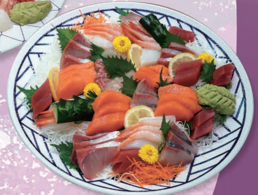
刺身盛合せ(5~7人前) 9,350円(8,500円税抜価格)[43cmφ]

●季節により料理の内容、器など変わる場合がございます。 ●ご提供内容によって税率が変わる場合がございます。