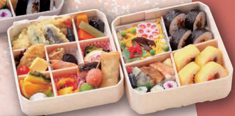
こうみ 二段重ね [香味] 3,300円(3,000円税抜価格) [7寸/20cm×20cm]