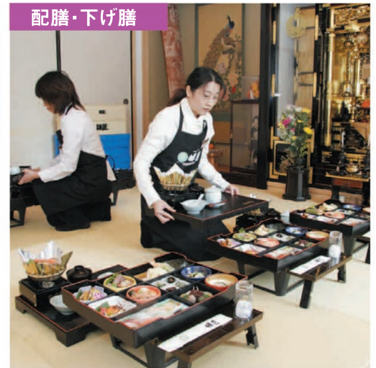
配膳・下げ膳 法要・祝事の会食における配膳とお片付けはスタッフが責任をもって行います。お料理の搬入、配膳からお片付けまでお客様のお手間を省き、まごころを込めてお手伝いいたします。