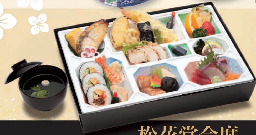
四季のあじわい膳 つばき [蕾] 3,630円(3,300円税抜価格) [28cm×38.5cm]