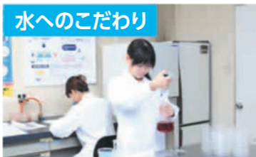
水へのこだわり 電解水生成装置を設置。野菜などの食材の水洗いには、洗浄効果のある強アルカリ性電解水、調理用具の洗浄には除菌効果のある強酸性電解水を使用しています。