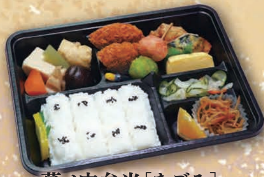
幕ノ内弁当 [なごみ] [26.5cm×20.5cm] 935円(850円税抜価格)