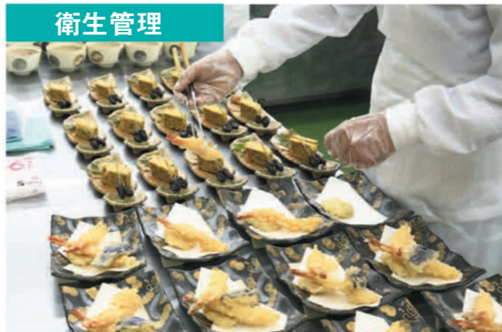
衛生管理 自社の品質管理室が、厳しい品質管理基準を設けています。安心してお料理をお召し上がりいただけます。