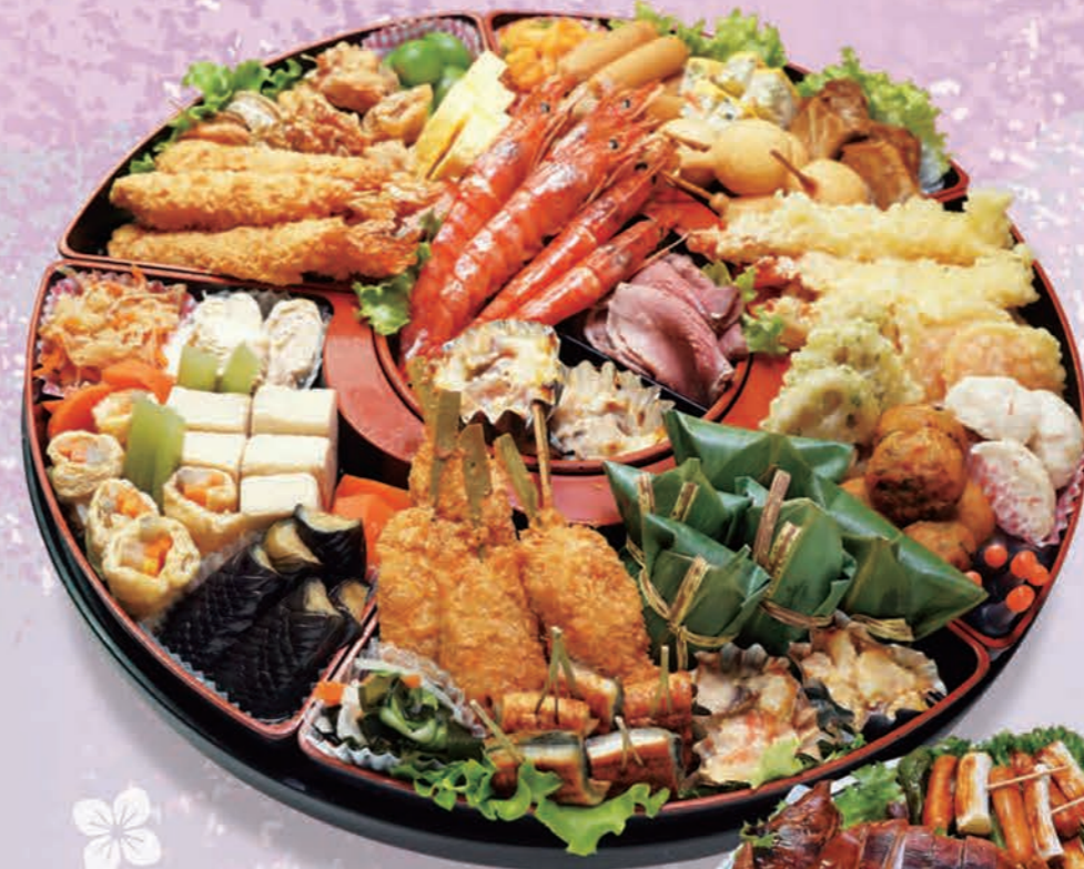
特大オードブル(7~8人前) 13,200円(12,000円税抜価格) [47cmφ]