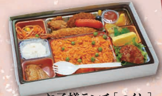
お子様ランチ [つくし] 1,375円(1,250円税抜価格) [28cm×18cm]