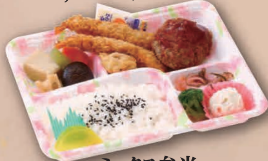
ミックス弁当 [27cm×22cm] 1,320円(1,200円税抜価格)