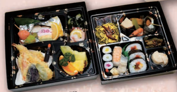
つばき 二段会席 [椿] 3,850円(3,500円税抜価格) [上段/26.5cm×26.5cm 下段/24cm×24cm]