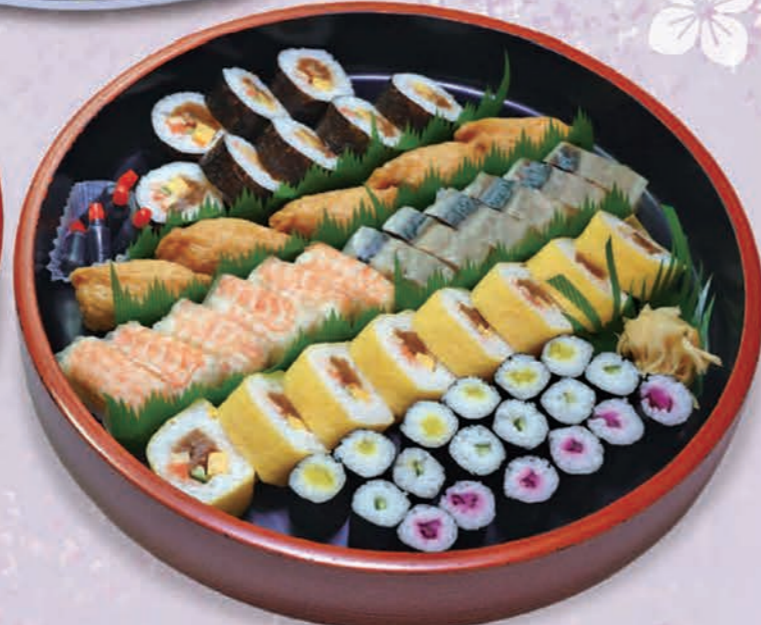
巻寿司の桶盛合せ(8~10人前) 3,520円(3,200円税抜価格)[40cmφ]