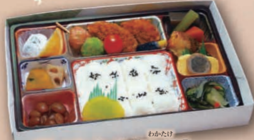
わかたけ 幕ノ内弁当 [若竹] [28cm×8cm] 1,100円(1,000円税抜価格)