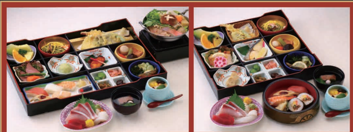
松花堂会席[花すがた] 7,700円(7,000円税抜価格) [38cm×50cm]