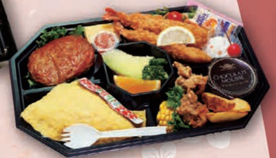
お子様ランチ [ひまわり] 2,530円(2,300円税抜価格) [38cm×25cm]