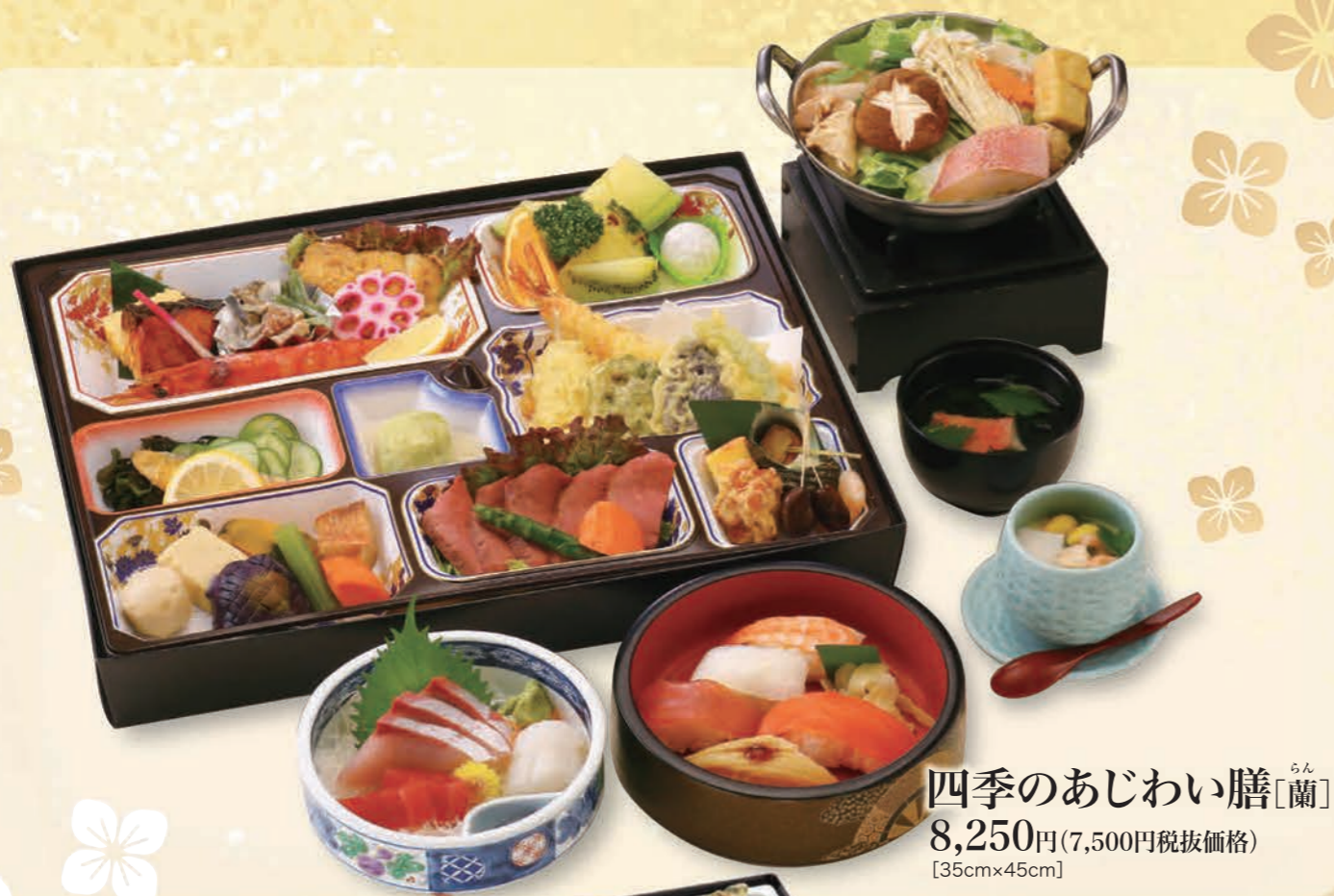
四季のあじわい膳 らん [蘭] 8,250円(7,500円税抜価格) [35cm×45cm]