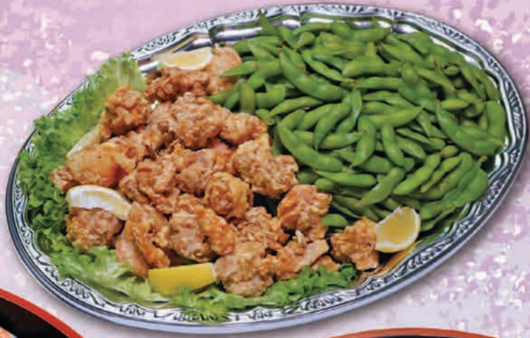
唐揚・枝豆セット 2,640円(2,400円税抜価格) [47cm×32cm]