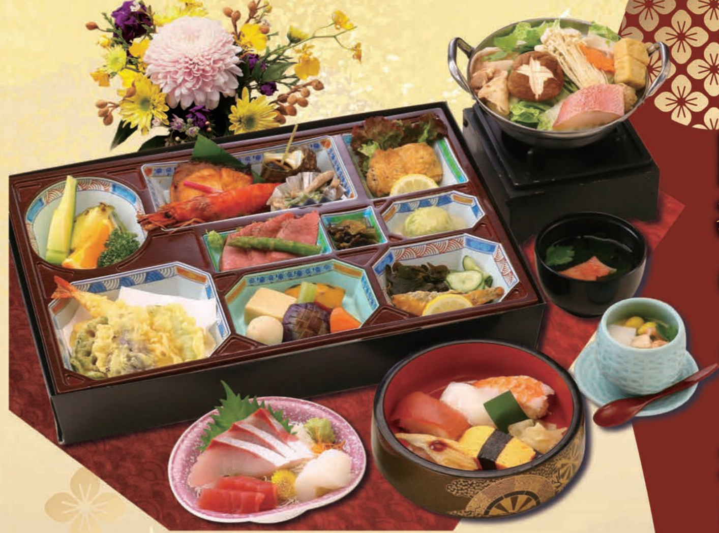
四季のあじわい膳 たちばな [橘] 6,930円(6,300円税抜価格) [32cm×45cm]