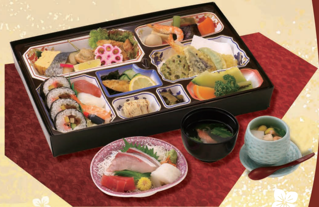
四季のあじわい膳 はす [蓮] 5,830円(5,300円税抜価格) [30.3cm×44cm]