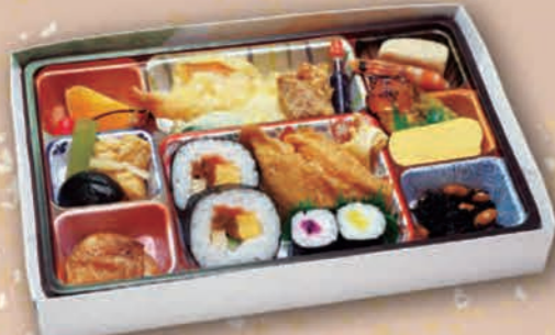
味ごよみ 1,100円(1,000円税抜価格) [28cm×18cm]