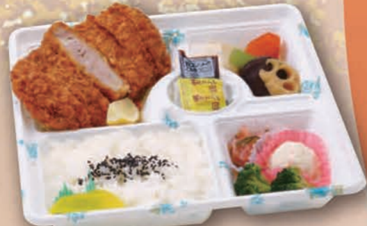
とんかつ弁当 [27cm×27cm] 1,650円(1,500円税抜価格)