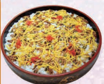
一升 5,060円(4,600円税抜価格) [47cmφ]