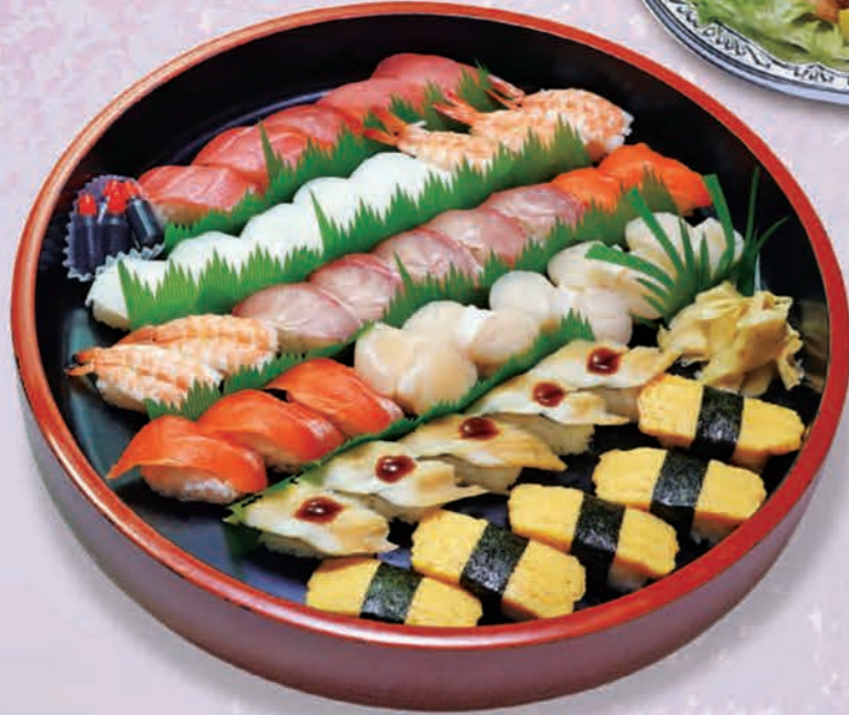
にぎり寿司の桶盛合せ(8~10人前) 5,830円(5,300円税抜価格)[40cmφ] ※ワサビ抜きできます

●季節により料理の内容、器など変わる場合がございます。 ●ご提供内容によって税率が変わる場合がございます。