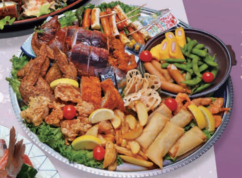
酒の肴オードブル(5~7人前) 5,830円(5,300円税抜価格) [45.5cmφ]