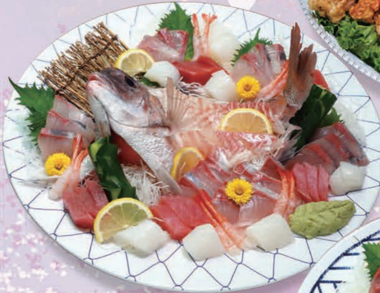
鯛姿刺身盛合せ(8~10人前) 13,750円(12,500円税抜価格) [45cmφ]