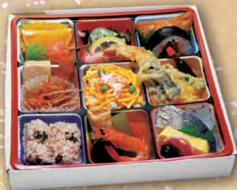
食彩弁当 1,650円(1,500円税抜価格) [24cm×24cm]